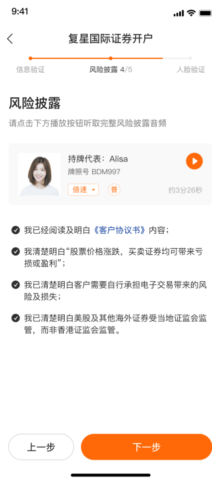
风险披露说明，请记得勾选所有选项，可以倍速播放