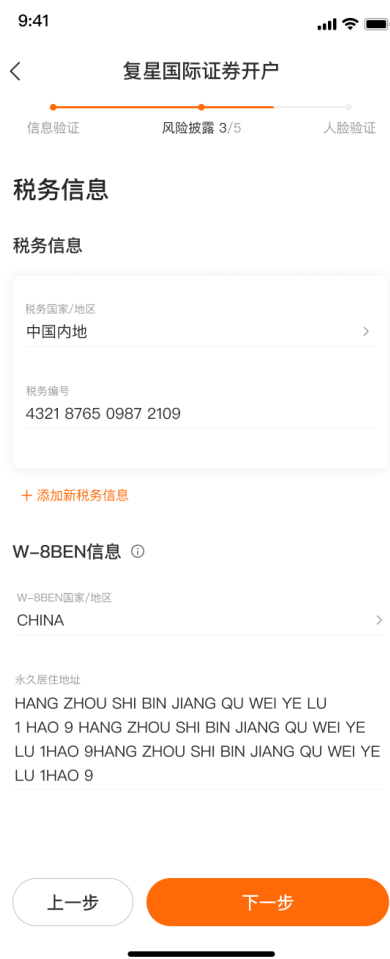
个人税务信息填写，大陆用户税务编号为身份证号